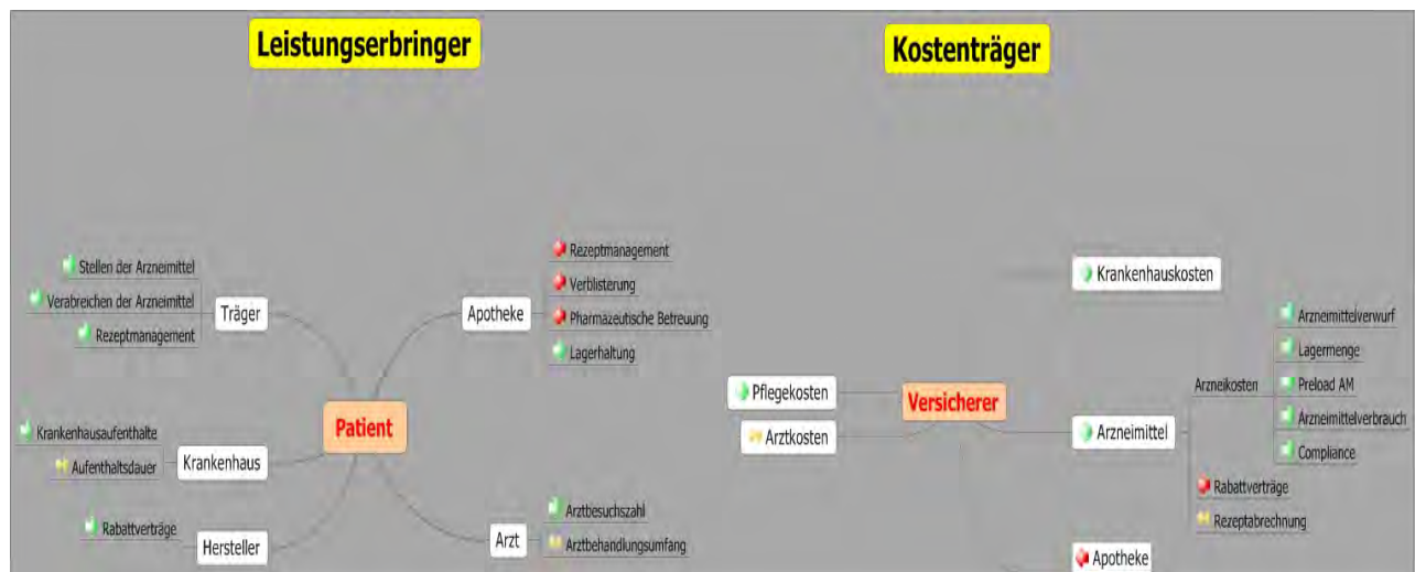
Abb.: Darstellung der Auswirkungen automatisierter Verblisterung auf Dienstleister und Kostenträger. Wirtschaftliche Vorteile sind dabei mit grünen Pfeilen, Nachteile mit roten Pfeilen verdeutlicht. Änderungen ohne deutliche wirtschaftliche Einflüsse tragen einen gelben Doppelpfeil