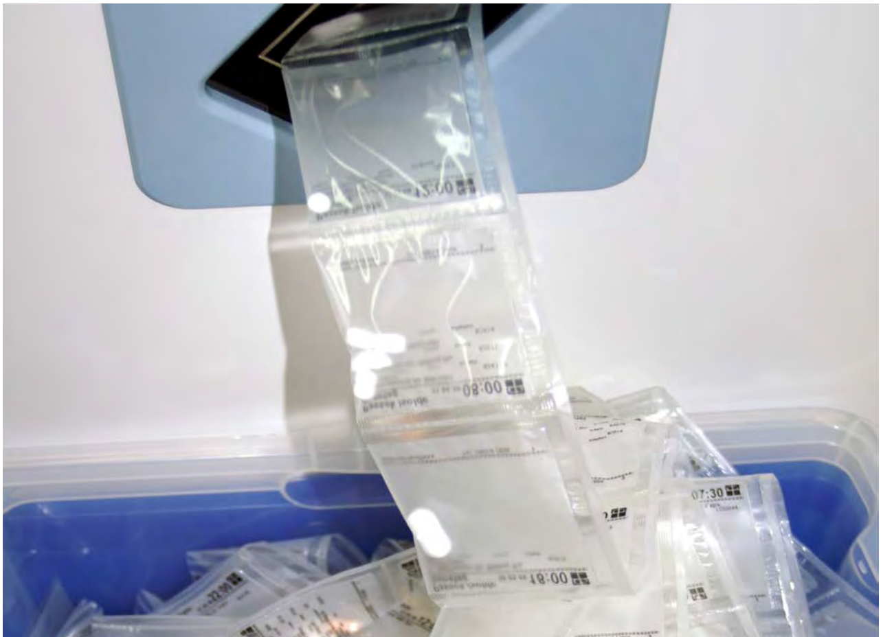
Abb.: Schlauchbeutel sind eine der Arten, wie die Dauermedikation für Patienten automatisiert gezielt vortportioniert werden kann.

Hierbei werden die Medikamente für den einzelnen Patienten pro Einnahmezeitpunkt portioniert, versiegelt und die Packung – zumeist in Tütchenform – unverwechselbar beschriftet. Als Ziel dieser Dienstleistung wird die Vermeidung von Fehlern beim Stellen genannt. [Hübner und andere]